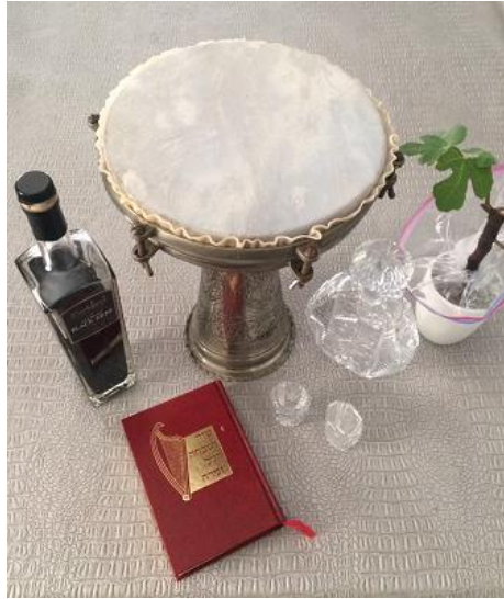
"Arak and Darbeka" by Mitchell D Betesh

For Shabbat Shemini (Leviticus 9:1- 11:47), prayers are conducted in Maqam HOSENI according to SUHV (Red Book) and at least 14 other sources. This selection is based on the perasha which deals with the inauguration of the tabernacle (mishkan). Being that the tabernacle houses the Ten Commandments, something described as "beautiful," HOSENI, a word that means 'beautiful' in Arabic, is most appropriate. The melody of Hoseni is often described as a higher version of Maqam Bayat. HAZZANUT: Special for Shabbat HaHodesh (as per H Moshe Ashear): Semehim: Asheer LeEl Ayom; song on page 256, referencing the months of the year.